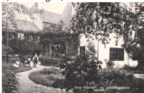
Torben Hestehaves arkiv indeholder dette postkort fra haven til højskolen

I perioden før Første Verdenskrig havde skolen op til 40 elever. Højskolen ophørte i 1920 kort efter Søren Sallings død.